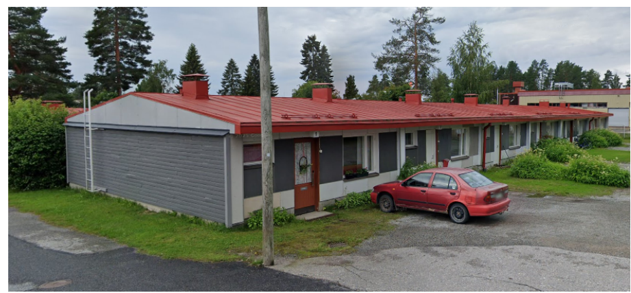
PURETTAVA ASUINRIVITALO A

URAKKA-ALUEelta poistetaan kaikki pensaat ja kasvit, puista kolme suurta mäntyä jätetään, muut poistetaan