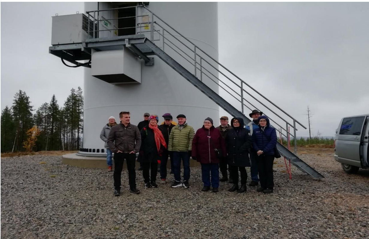
Matkalaisia tuulimyllyn juurella Kivivaara – Peuravaara - alueella

Ensimmäinen matkakohteemme oli Hyrynsalmen komea kunnantalo, missä kunnanjohtaja otti meidät vastaan yhdessä kunnanhallituksen ja kunnanvaltuuston puheenjohtajien kanssa. Esittelyjen ja kahvittelun jälkeen saimme ihailta kunnantalolla hyrynsalmelaista käsityöperinnettä tutustumalla Tommi-puukkonäyttelyyn. Kunnantalon upeassa valtuustosalissa kunnanjohtaja esitteli Hyrynsalmen tuulivoimatilannetta. Hyrynsalmi on laatinut hankerahan avulla strategisen tuulivoimakartan, josta ilmenee tuulivoimapotentiaaliset alueet ja myös ne alueet, mihin myllyjä ei voi sijoittaa (esim. asutuksen, luonnonpuistojen, muinaisjäämistöjen, suojeltavien kasvien tai eläinten esim. porojen tai puolustusvoimien rajoitusten takia). Karttaan oli myös merkitty ne alueet, joille myllyjä ei haluta esim. matkailun takia. Tuulivoimainfon jälkeen siirryimme bussilla Kivivaara-Peuravaara tuulivoimapuistoon, joka sijaitsee Hyrynsalmen ja Suomussalmen kuntien raja-alueella. Sumuisena päivänä osa 11 tuulimyllystä oli pysähdyksissä huoltokatkojen takia.