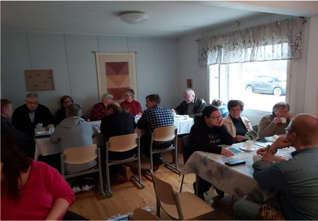
Kyläparlamenttien yhteinen kokoontuminen Pesiön kylätalolla